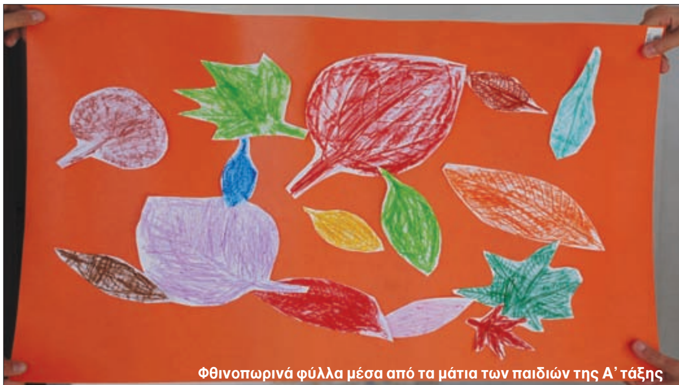
Φθινοπωρινά φύλλα μέσα από τα μάτια των παιδιών της Α' τάξης