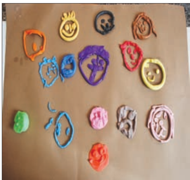
Τα συναισθήματα των παιδιών της Α' τάξης για το καινούργιο τους σχολείο.