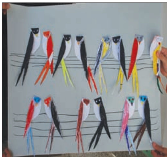
Πουλιά στα σύρματα