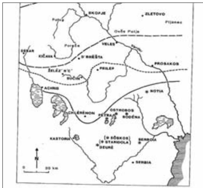
Χάρτης με αναφορά στον Οστροβο, τέλη 13ου αι. - αρχές 14ου αι