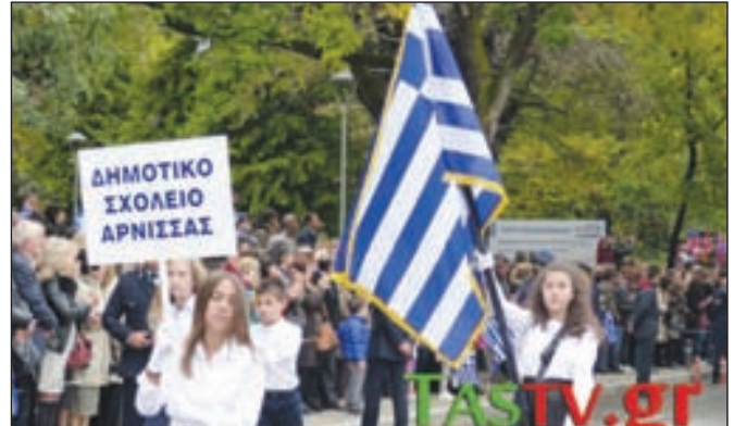
18 Οκτωβρίου – Απελευθέρωση της Έδεσσας

Κείμενο-Δακτυλογράφηση: Κωνσταντίνα Παπαζήση – ΣΤ' τάξη